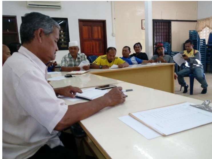
KDB DAN MY SOAL RTP SG ULAR