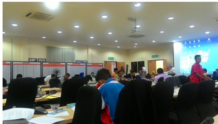
MY SOAL PERINGKAT DAERAH