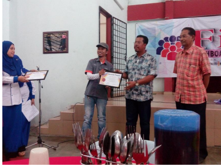
DASHBOARD KOMUNITI KG TEMPOYANG